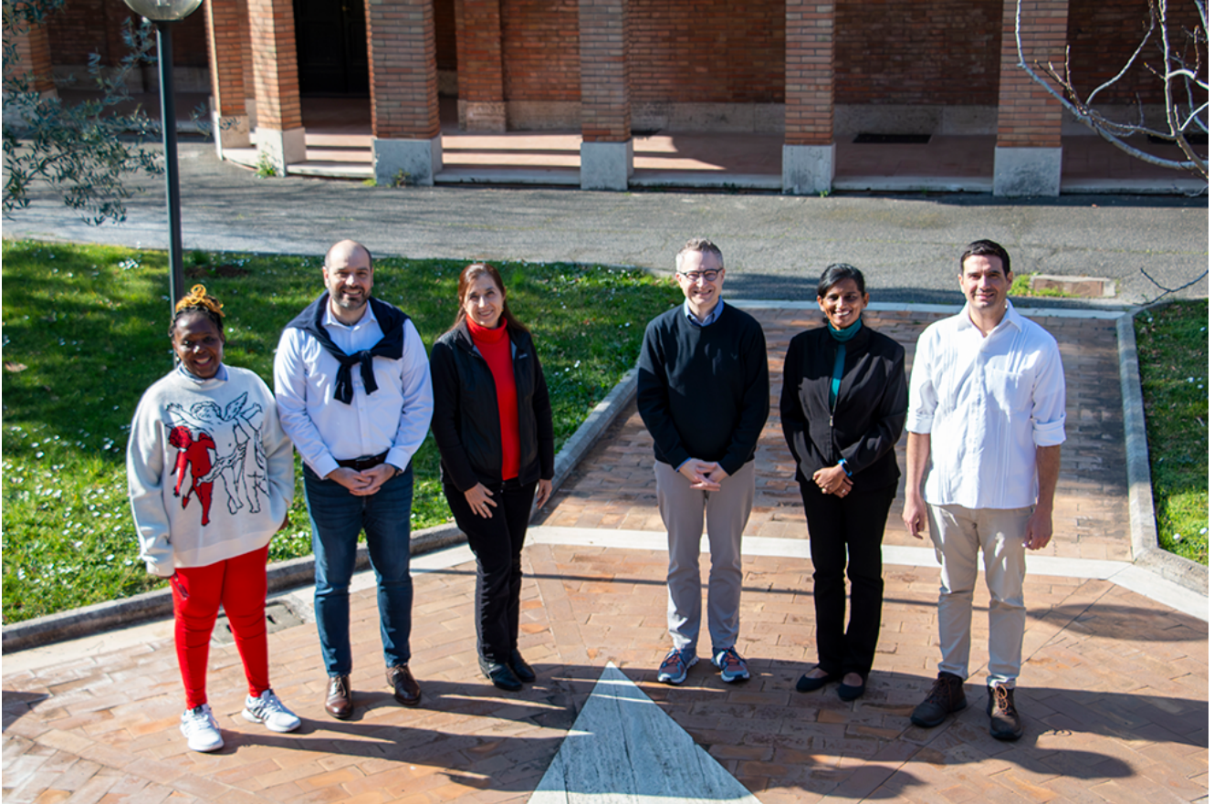
Consejo Internacional de Asociación y Misión Educativa Lasaliana (CIAMEL)