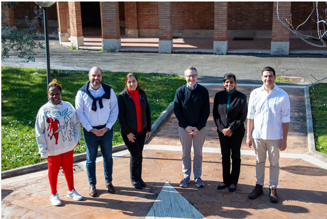
Consiglio Internazionale dell'Associazione e della Missione Educativa Lasalliana (CIAMEL)